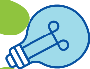
LAMPADINE A FLUORESCENZA