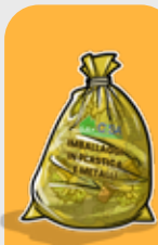
IMBALLAGGI IN PLASTICA E METALLI