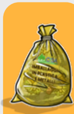
IMBALLAGGI IN PLASTICA E METALLI