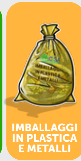
IMBALLAGGI IN PLASTICA E METALLI